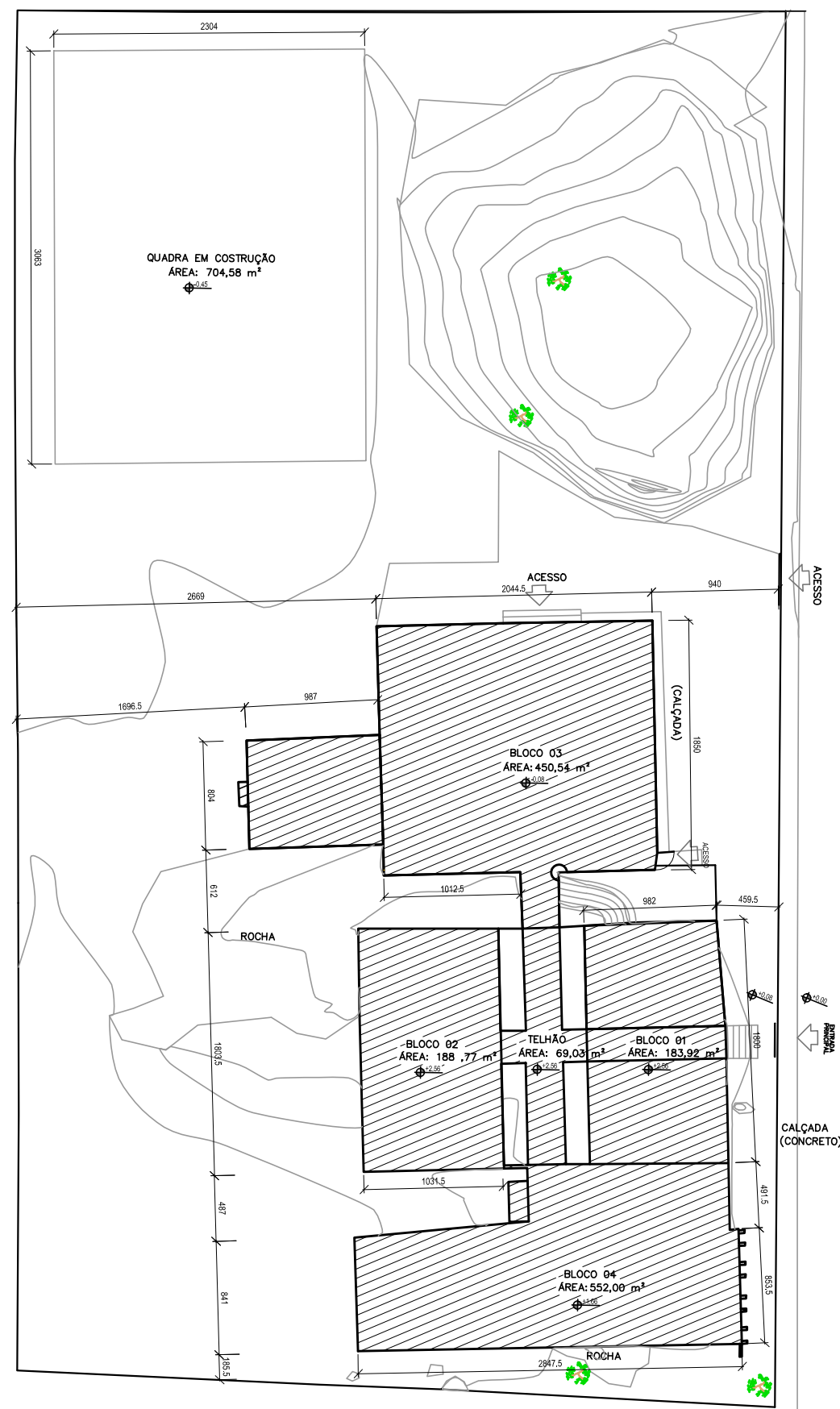
PLANTA BAIXA - LEVANTAMENTO